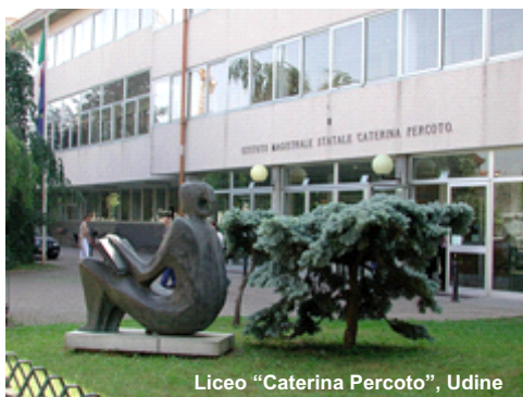
Liceo "Caterina Percoto", Udine